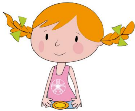
une fil le

Tu le dis et tu souffles en même temps. C'est le ill de fil le et le il de ré veil .