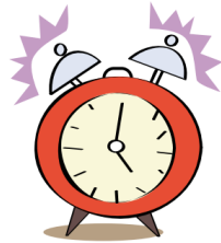
un ré veil

une fille une bille une coquille une béquille la vanille la famille un billet le grillage