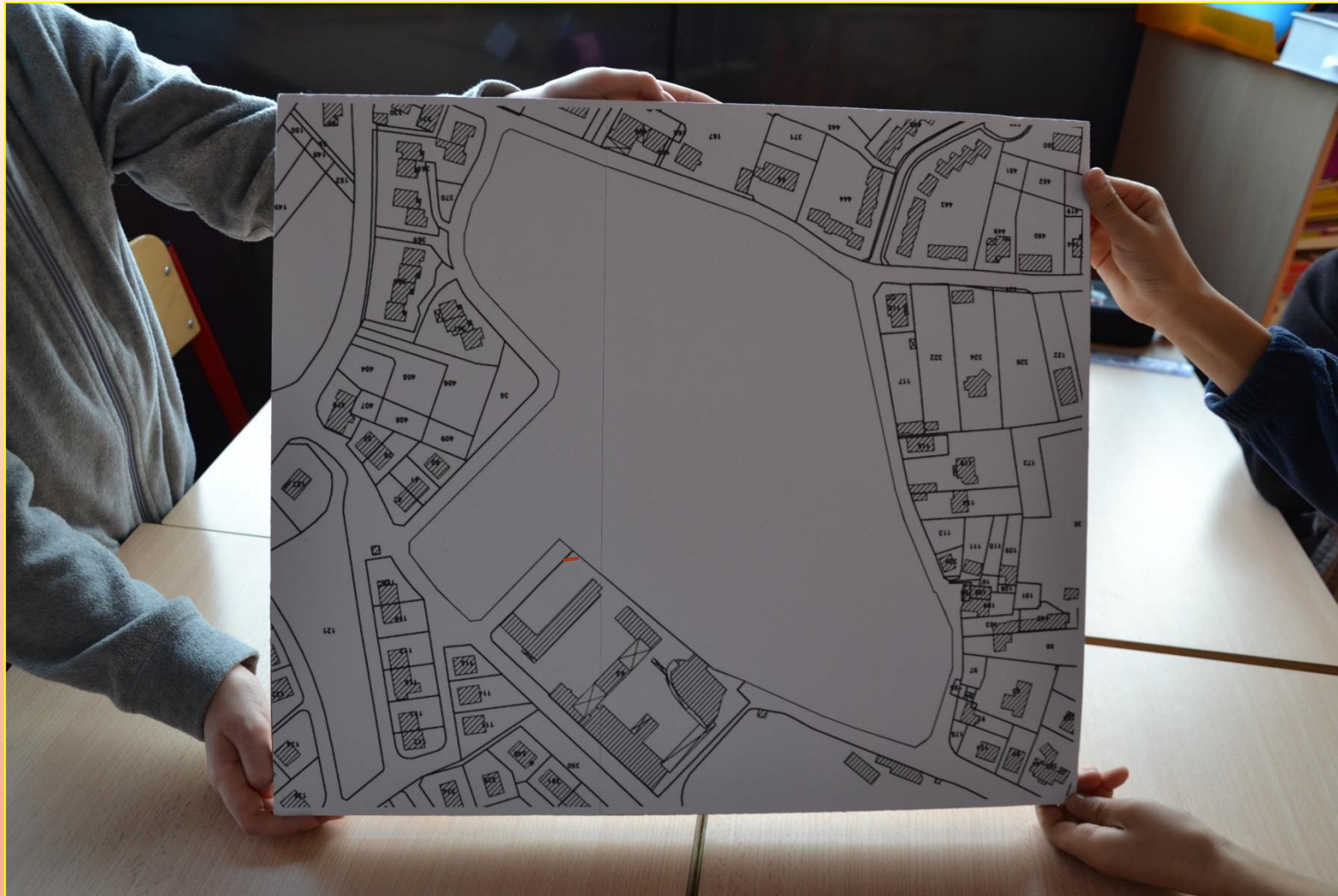
PLAN DU QUARTIER DE L'ECOLE