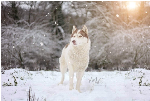
Ébène – Robe Blanche & Grise