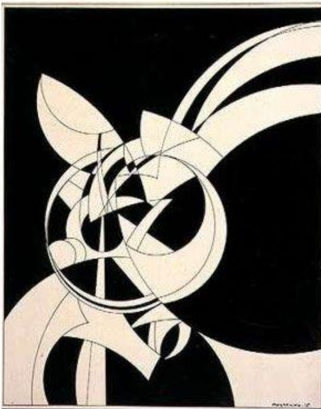
Grand linear composition en noir et blanc

Alexander Rodtchenko est un artiste russe né en 1891 et mort en 1956. Il était à la fois peintre, sculpteur, photographe et designer. Au début de sa carrière, il a travaillé sur les motifs géométriques avant d'abandonner la peinture et de se tourner vers la photographie.