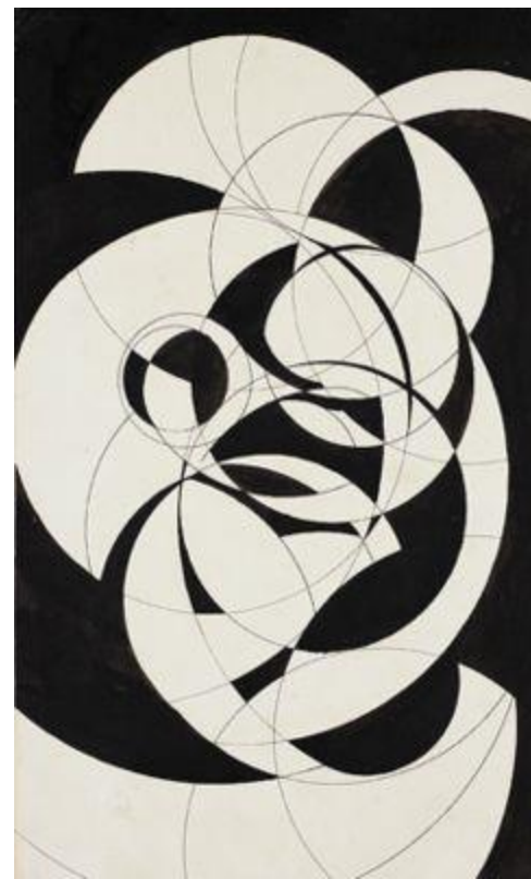
Composition au compas