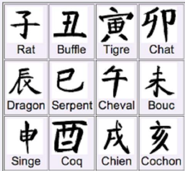
les idéogrammes chinois