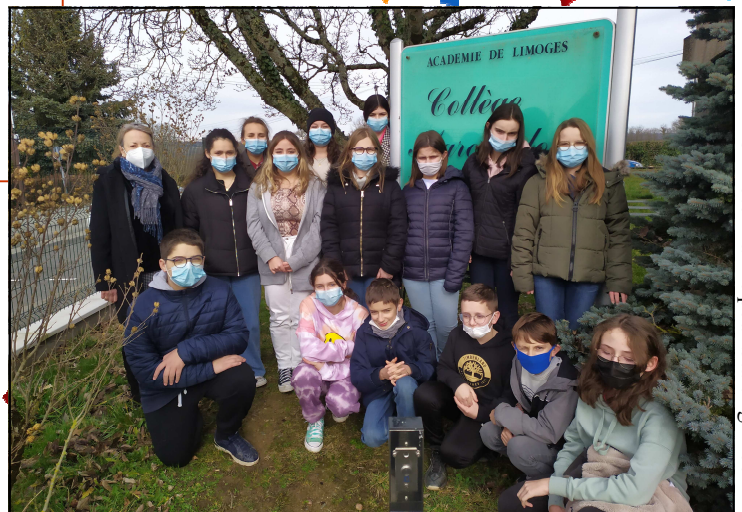
L'équipe de rédaction 2021